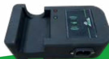
Culla carica batteria cod. 4000WD Battery charger cradle code 4000WD